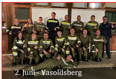
2. Juni - Vasoldsberg