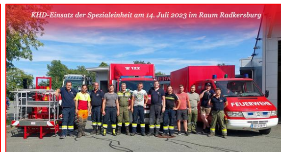
13. Juli - Brand in Höf bei Gnas – Assistenz mit ALK... 14. Juli – MRAS-Einheiten und TL waren im KHD-Einsatz in RA